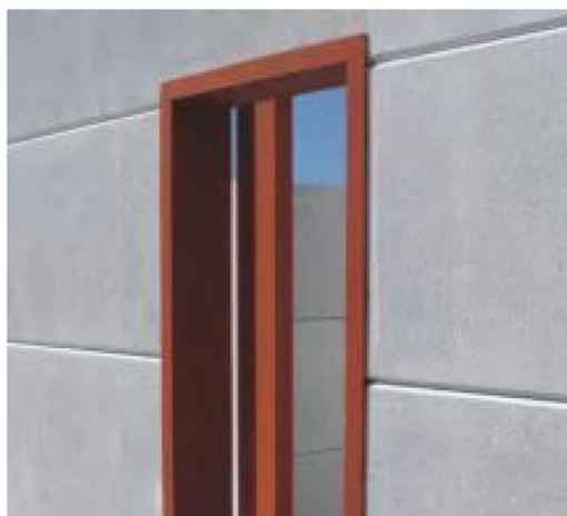
شکل ۲- نصب نعل‌درگاه و بازشوها

۸-۱۴- در پانل‌های قرار گرفته در کناره‌های بازشوها باید تو رفتگی جهت قرار گیری نعل‌درگاه‌های پیش‌ساخته AAC تعبیه شود. حداقل نشیمن پانل نعل‌درگاه ۵۰۰ میلی‌متر است. دور تا دور بازشوها باید قاب فلزی ناودانی با حداقل ضخامت ۲ میلی‌متر بچرخد.