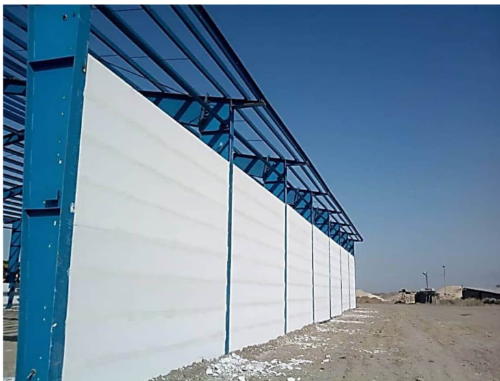
شکل ۱- اجرای پانل AAC

بتن AAC از سیلیس، سیمان، گچ، آهک، پودر آلومینیوم و آب ساخته می‌شود که حاصل ترکیب این مصالح وجود میلیون‌ها سلول ریز هواست که ویژگی سبک وزنی و عایق حرارتی بودن بتن را به دنبال دارد. پانل AAC، در حقیقت پانل‌های بتن سبک پیش‌ساخته در کارخانه می‌باشد که کاربردهای مختلفی دارند. یکی از این کاربردها استفاده از آنها به عنوان دیوار داخلی یا خارجی می‌باشد. ماتریس این پانل‌ها بتن هوادار اتوکلاو می‌باشد و المان مسلح کننده آن‌ها عموماً یک لایه یا دو لایه شبکه میلگرد فولادی براساس طراحی می‌باشد. به طور کلی مقاومت برشی درون صفحه پانل AAC به مقاومت برشی AAC غیر مسلح محدود می‌شود. در رفتار خمشی خارج از صفحه این پانل‌ها پیوستگی بین میلگرد و بتن سبک توسط لهدگی بتن در تماس با میلگردهای عمود مش تأمین می‌شود بنابراین آچار بودن یا بدون آج بودن میلگرد در این پانل‌ها تفاوتی از لحاظ طراحی ایجاد نمی‌کند.